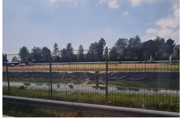
Akses jalan menuju pos.