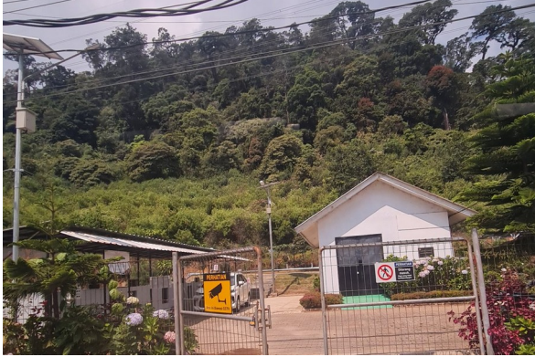
Pos security & bangunan pendukung di kawasan PLTP Patuha.